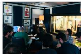
PERWORK & Doppiaggio Studio Sound Design Faminore – Impruneta