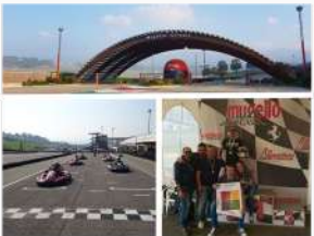
Go-Kart & Intelligenza emotiva Circuito del Mugello – Pista Kart "Il Mugellino"