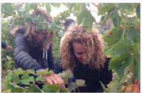
Vendemmia & spremitura dell'uva Azienda Agricola di Montepaldi - San Casciano