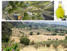
Raccolta Olive & Produzione olio Fattoria di Maiano, Firenze