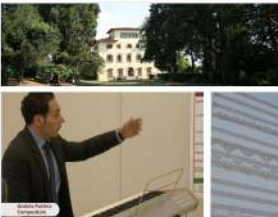
Componi l'Inno della tua Azienda! Scuola di Musica di Fiesole