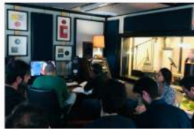
PERWORK & Doppiaggio Studio Sound Design Faminore - Impruneta